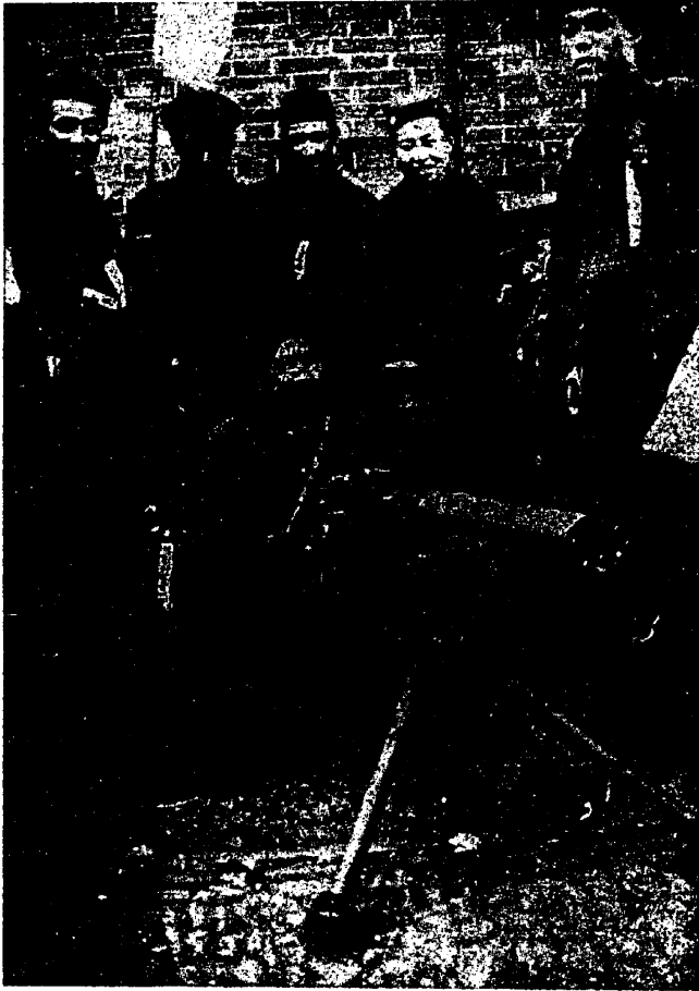
א קיילגווארפער פון אן ארבעטער-מאכע אין שאנכאי

צעשאסן די דעמאנסטראציעס פון די ארבעטער און לערן-יונגט. אסאך ארבעטער זיינען דעמאלט אומגעקומען פון די ענגלישע קוילן. אסאך ארבעטער און סטודענטן זיינען געטויט געווארן אף די פלע-